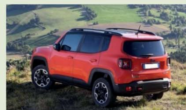
Jeep Renegade 2.0 mjt 140 cv limited 4x4 (già percorsi 3.308 km)

48 mesi/60.000 km compresi Da € 398,00 al mese