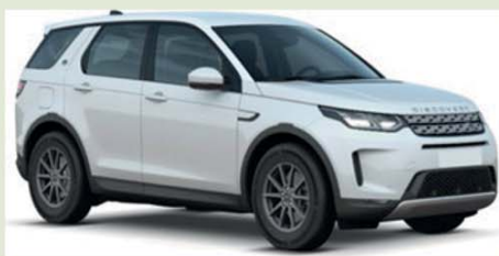
Land Rover Discovery Sport 2.0 TD4 2wd 150 cv Pure 2WD Sport (già percorsi 15.358 km)

La soluzione più conveniente per i NEOPATENTATI... e per le nuove P.IVA!