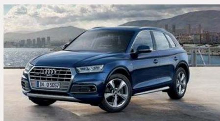
AUDI Q5 35 TDI Business S tronic

36 mesi/40.000 km inclusi Da € 484,00 al mese