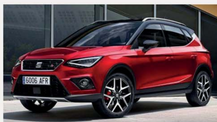
SEAT ARONA 1.0 TGI 66 Kw Reference Metano

36 mesi/40.000 km inclusi Da € 484,00 al mese