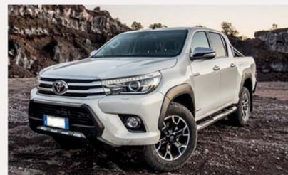
TOYOTA HILUX 2.4 D - 4D DC LOUNGE 4WD

42 mesi/45.000 km compresi Da € 195,00 al mese