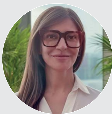
di DANIELA MULAS